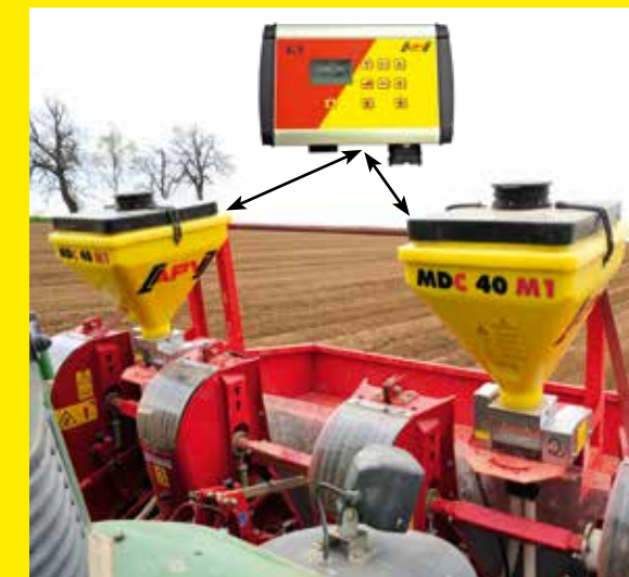
4-reihige Nutzung z.B.: beim Kartoffel legen